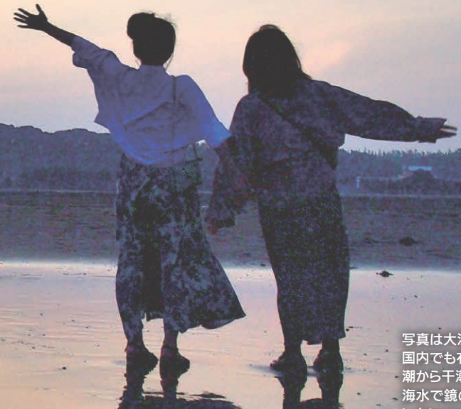
写真は大洗町の大洗サンビーチ。国内でも有数の遠浅ビーチで、満潮から干潮に向かう時間、浜辺が海水で鏡のように反射する「リフレクションビーチ」として写真映える撮影スポットになっています。

満潮から干潮に向かう 遠浅の浜辺が反射する 天空は鏡の中の色えんぴつ 毎日届く新聞は 時代を映す身近な鏡 新聞を読んで感じたこと 自分の言葉で書いてみよう